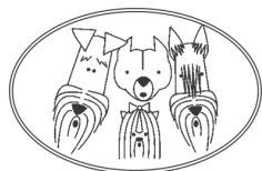
SLOVENSKI KLUB ZA TERIERJE